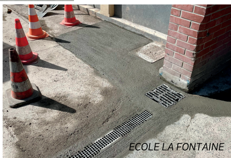
ECOLE LA FONTAINE