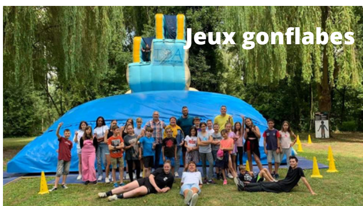
Fête de clôture juillet