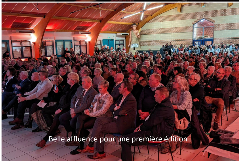
Belle affluence pour une première édition