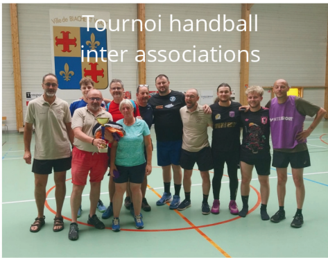
Tournoi handball inter associations