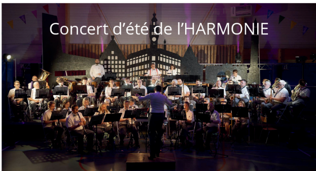
Concert d'été de l'HARMONIE