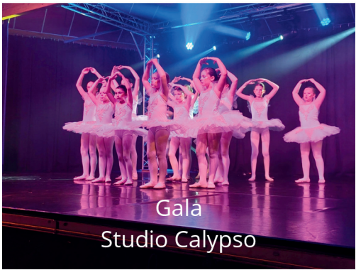
Gala Studio Calypso