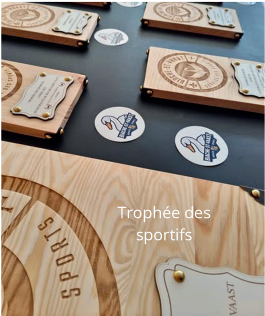
Trophée des sportifs

Juin était intense : Superbes galas de STUDIO CALYPSO, de KDANSE TEAM, de l'AÏKIDO, et de GYM JEUNESSE qui fêtait ses 30 ans. Juin était sportif avec les parcours du cœur pour le grand public en partenariat avec le CKB et la BALADE BIACHOISE, mais aussi avec l'école Jean de LA FONTAINE, avec le handball qui recevait les finales départementales des coupes jeunes et qui a ressuscité le tournoi inter associations avec succès, avec la victoire de l'US BIACHE FOOTBALL en finale de la coupe du Pas-de-Calais chez les vétérans. Enfin, juin était placé sous le signe de l'innovation avec la première édition de la guinguette et de l' "apér' eau" sur la Scarpe avec le CANOE-KAYAK. On n'oubliera pas non plus l'HARMONIE "LA RENAISSANCE" qui a proposé son festif concert d'été.