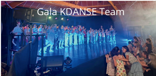
Gala KDANSE Team