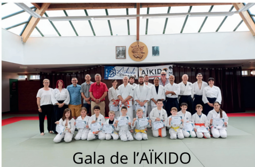
Gala de l'AÏKIDO