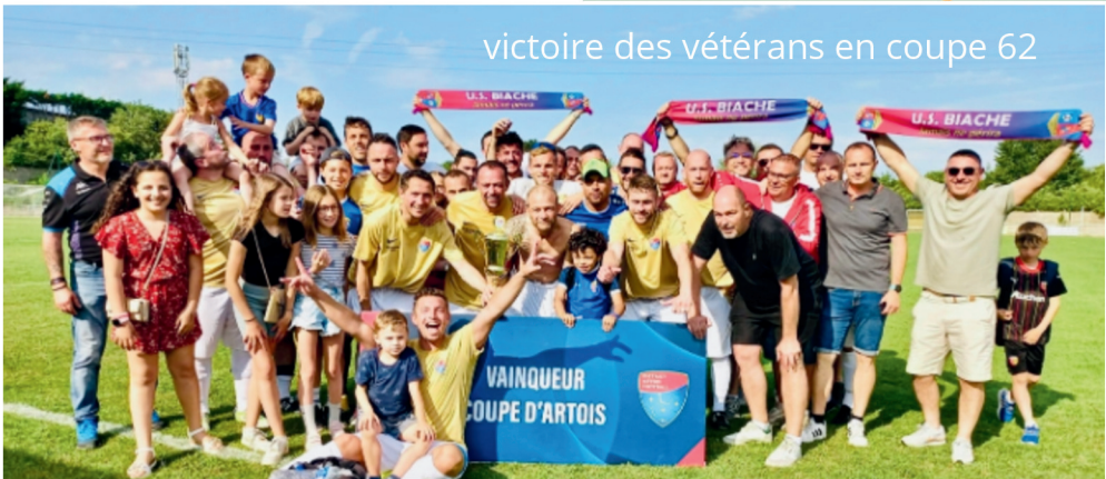
victoire des vétérans en coupe 62