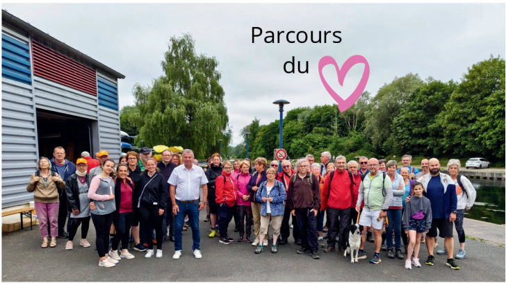
Parcours du cœur